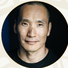
Benjamin Joon Meditationeherer